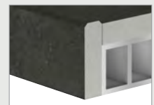
FW Werkblad met waterkering