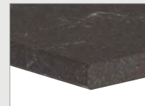
1F/2F Werkblad/ achterwand inclusief enkel/dubbel facet