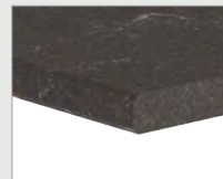
1F/2F Werkblad / achterwand inclusief enkel/dubbel facet