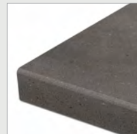
RR Werkblad met afgeronde rand