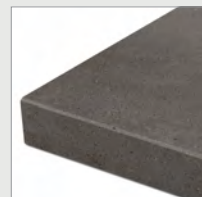
VF Werkblad met verstekrand